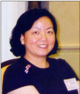
方方(1955年5月11日-)，本名汪芳，祖籍江西省彭澤縣，生于江蘇省南京市，成長于湖北省武漢市，中國當代女作家，曾任湖北省作家協會主席、省文學創作系列高評委會主任，中國作協全委會委員，文學創作一級作家職稱。