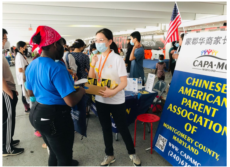
一個 CAPA-MC 志願者解釋黃哨子項目

許多學生也來到返校節現場做志願者, 分發零食并協助工作人員。一位志願者表示: “COVID 已經存在一段時間了; 每個人都很沮喪。學校又要開學了, 這個活動是一個讓我們可以認識很多人, 并了解他們的機會。”