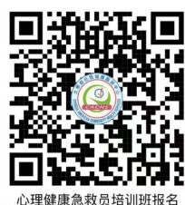
心理健康急救員培訓班報名