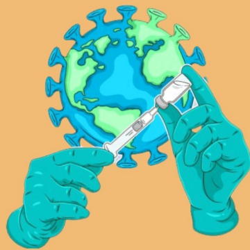
This program and its activities are funded by the Asian American Health Initiative (AAHI), a part of the Montgomery County Department of Health and Human Services, and the Primary Care Coalition of Montgomery County.