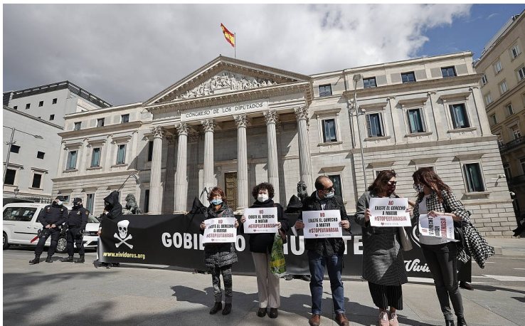
當地時間2021年3月18日,西班牙馬德里,反對安樂死的示威者在西班牙議會外抗議。西班牙眾議院當天通過了安樂死法規。